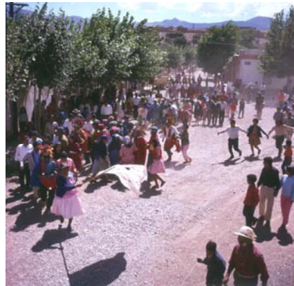
Imagen 5. Comparsa Los Picaflores bailando carnavalito. Humahuaca. 1970.