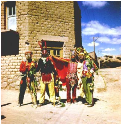
Imagen 4. Domingo de Tentación. Disfrazados con sartas para la Pachamama. Humahuaca. 1976.

Zuleta asume que en la cultura indígena se puede ser indio aún viviendo en la ciudad, en el mundo moderno, pero conservando la lengua, haciendo sus ritos a la Pachamama, viviendo en armonía con la naturaleza y compartiendo los problemas de los indígenas (Vázquez , 1995:153), considera que “ en la sociedad de consumo, los indios, con nuestra cultura tradicional, no tenemos cabida, pues en ella se suprime nuestro proceso vital armónico... ” (Op. Cit: 155). Por ello rescata la cultura tradicional desde la visualidad como modo de contrarrestar los “cambios vertiginosos” que mencionaba anteriormente.